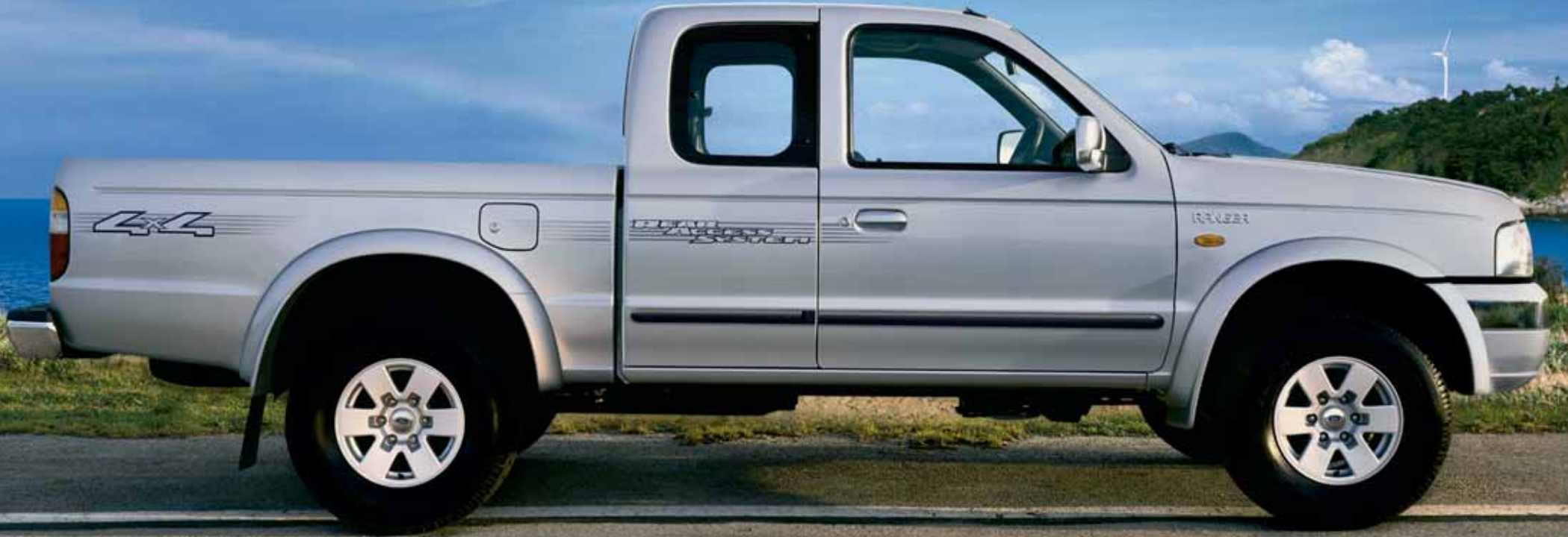
SuperCab XL 4x4 in Highlight Silver Metallic

قليل عدد الشاحنات التي يمكنها القيام بالعمل الشاق الذي تقوم به فورد رنجر ٢٠٠٥. فعندما يكون لديك يوم طويل حافل بالأعمال فإن هذه الشاحنة توفر لك الدعم المطلوب لاستكمال المهمات الصعبة، إذ تم تجهيزها بكافة المعدات اللازمة لأداء الأعمال الشاقة، فضلا عن مساحتها الداخلية الرحبة التي توفر لك الراحة والنشاط. وتتوفر رنجر بعدة طرازات منها ريجيولار كاب (Regular Cab) وسوبركاب (SuperCab) ودوبل كاب (Double Cab). وبما أنك قد لا تعرف ما الذي ينتظرك، ومن الذي ستصعبه معك، فيمكنك الاعتماد على جدارة ومرونة فورد رنجر.