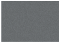
رصاصي تيتانيوم Titanium Grey