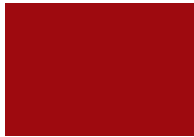
أحمر منسق Nifty Red