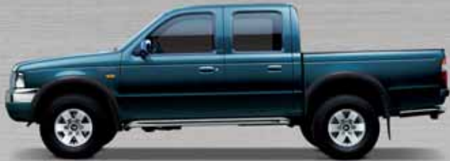
Double Cab XL in Medium Blue