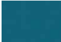
أزرق متوسط Medium Blue