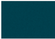
أخضر قائم Dusk Green