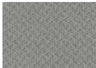
قماش رمادي Grey Cloth

تستخدم فورد دعماً شاملاً لإضفاء التبريد من الجمال والحماية. الألوان البنية هي نماذج فقط، ولا تتوفر كافة الألوان لجميع الطرازات. يرجى مراجعة التوكيل لمعرفة التلاصق، التلميع والخيارات.