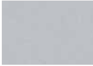
ميتاليك فضي لامع Highlight Silver Metallic